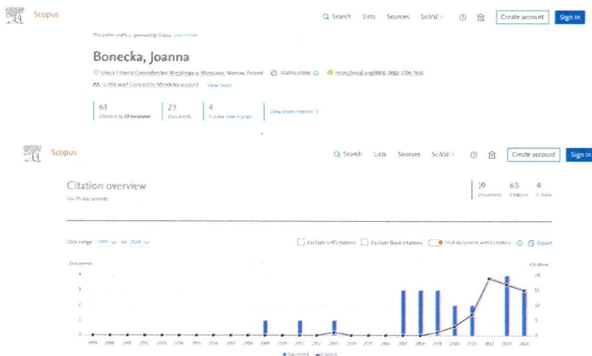
Rycina 2. Dane naukometryczne wg. bazy danych Scopus (z dnia 20.10.2024 r.).